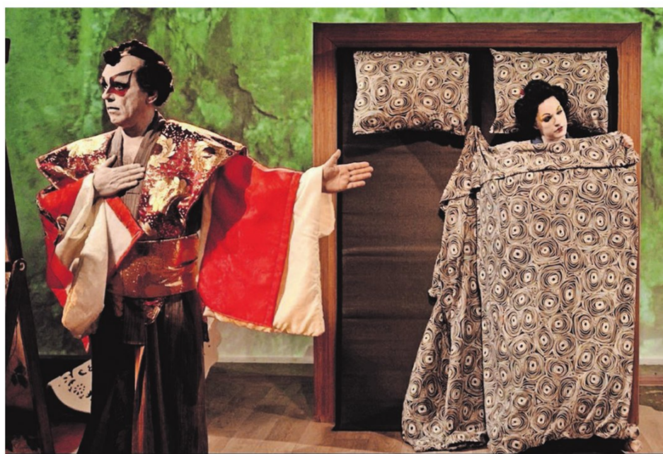
Beelden uit de film 'Als uw gat maar licht (If Yes, Okay)'.